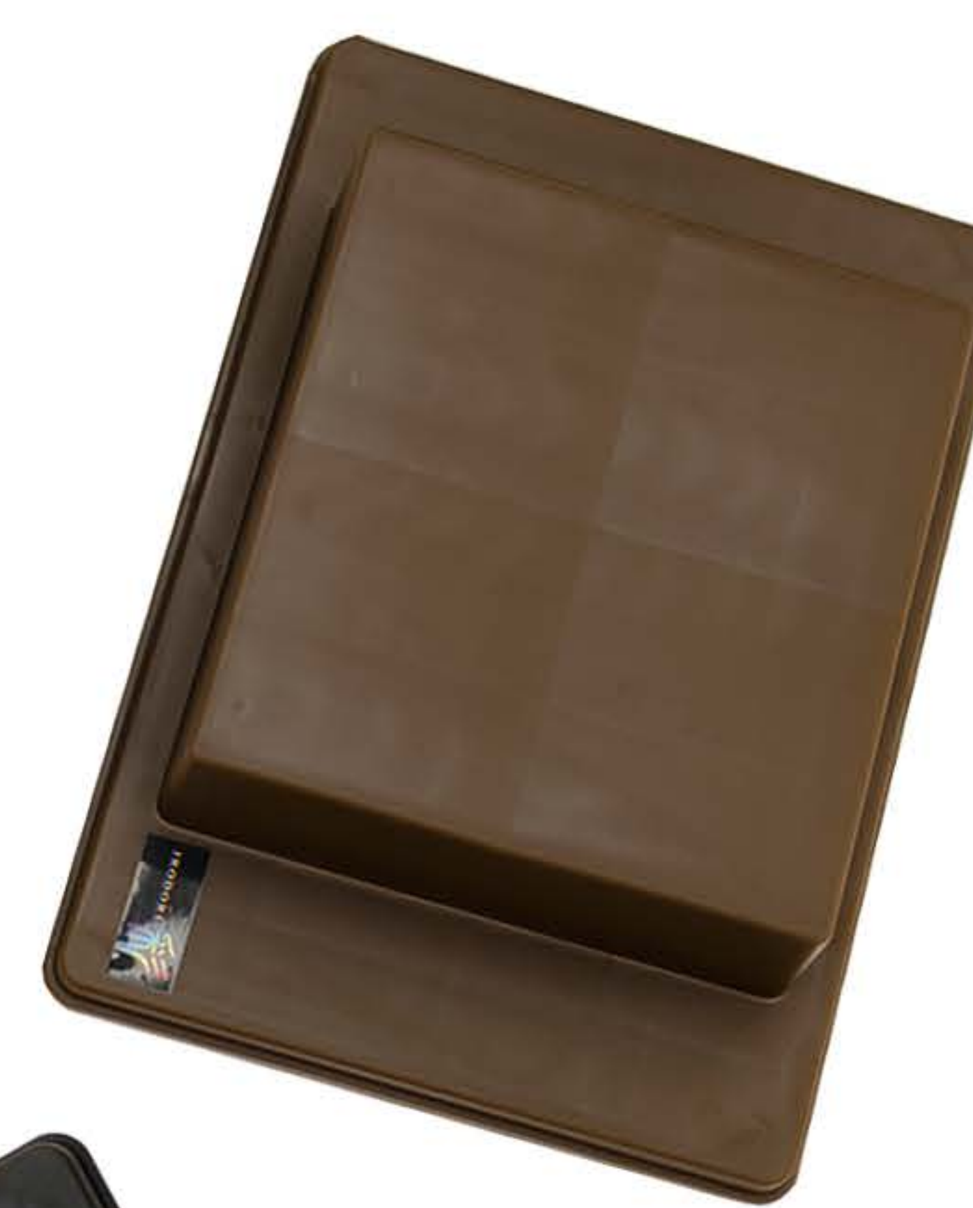
チョコレートブラウン